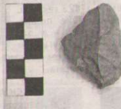
Скребло. Карасор 2.