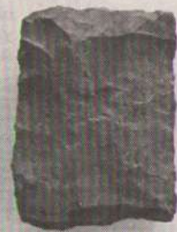
Дисковидное орудие. Карасор 2, энеолит, III тыс. до н. э.

Для выступления на региональных чтениях были подготовлены презентация и статья «История одного геоглифа или символ советской эпохи в истории Лисаковска», опубликованная в